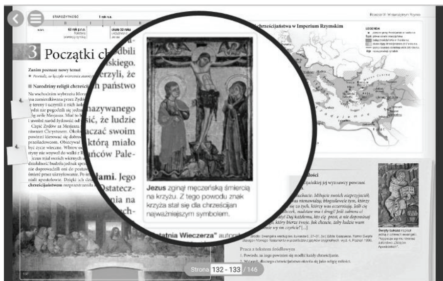
Ilustracja 3. Układ graficzny w e-podręczniku Nowej Ery.

Druga tendencja uwidacznia się w e-książkach Nowej Ery, które – choć przeznaczone są wyłącznie do odczytu ekranowego, jak zaznaczyłam podczas ich analizy pod kątem interaktywności – wykorzystują w tekście głównym krój dwuelementowy (z wyjątkiem podpisów pod ilustracjami). Decyzja ta ma jednak swoje wytłumaczenie. W kompozycji składającej się w dużym stopniu z ilustracji i elementów graficznych konieczne jest zastosowanie zabiegów, które pozwolą odseparować od siebie poszczególne fragmenty, w tym partie tekstu należące do różnych elementów struktury e-podręcznika. Dlatego (na wzór podręczników drukowanych) projektanci wyraźnie zaznaczyli granice między tekstem głównym a tekstami pobocznymi.