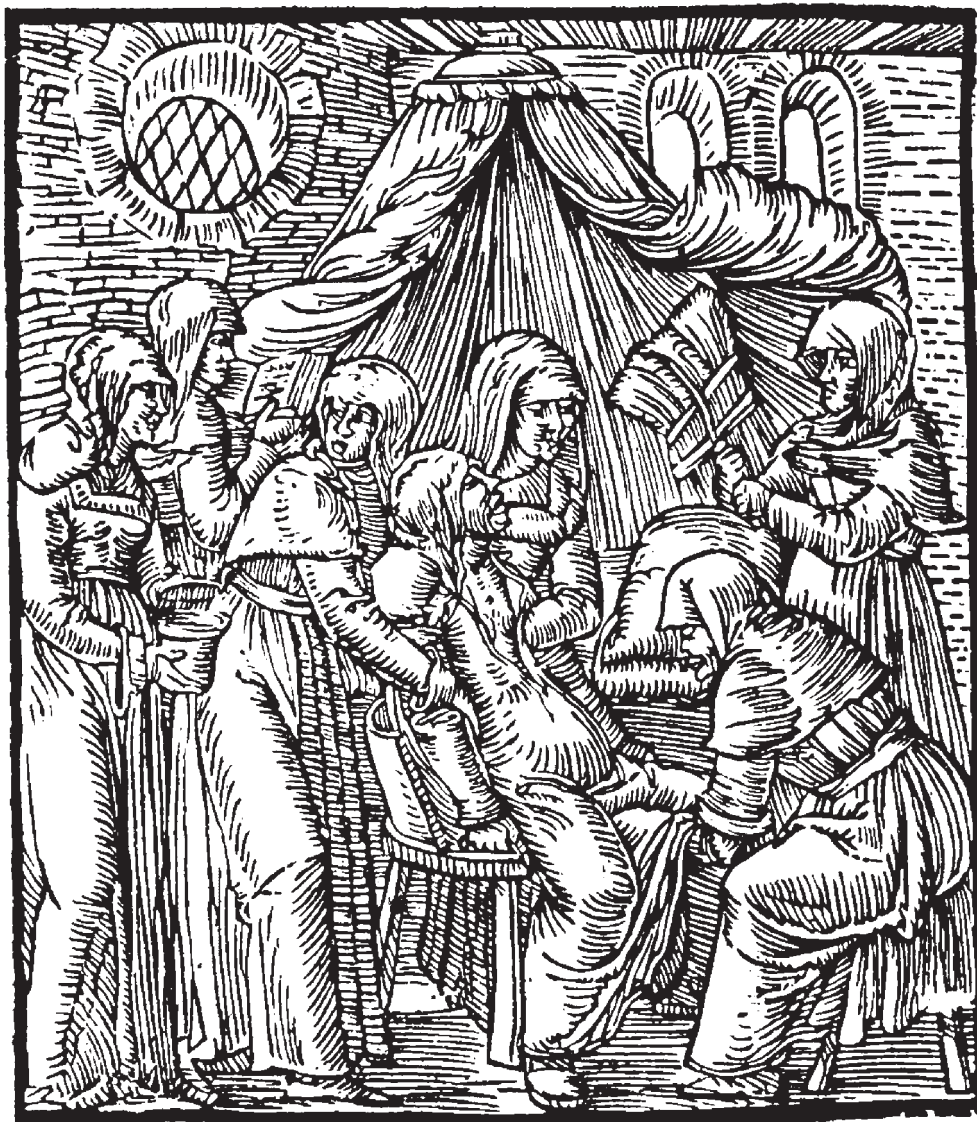
Poród – drzeworyt (S. Falimirz, O ziołach i mocy ich , op. cit.); za: Polonia Typographica saeculi sedecimi.... , op. cit., tabl. 257.